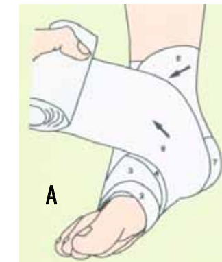
A. Aplicarea unor benzi elastice la nivelul piciorului

Tratamentul compresiv reprezintă o componentă de bază în arsenalul terapeutic din flebologie, alături de tratamentul chirurgical, scleroterapie și farmacoterapie. Indicația tipului și timpului de compresie depinde de patologia venoasă existentă, eficiența tratamentului compresiv bazându-se în primul rând pe experiența medicului curant iar succesul tratamentului depinde mult de calitatea recomandărilor medicale personalizate în funcție de fiecare pacient în parte cât și de complianța acestuia.